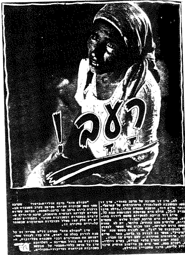
מעמים לא מעטות יצא "העולם הזה" במבצעים כמעט-צבאיים כדי לקדם את הנושאים החברתיים והפוליטיים שלמענם נאבק. הכתבים והצלמים הוגדרו כ"חוליות ניסוי". כאן, דוגמה מ-1953

בשנים הרבות של הופעת "העולם הזה", ובשמונה השנים שבהן היה לתנועת "העולם הזה – כוח חדש" ייצוג בכנסת, תחילה כסיעת יחיד, ואחרי בחירות 1969, כסיעה בת שני חברים, הצליחו העתון ואבנרי לעורר את דעת הקהל בישראל למחללי הפוליטיקה. מצד שני, דומה שפעילותם של אורי אבנרי וחבריו נותרה כאפיוודה בחיים הציבוריים בישראל. הדבר נבע, במידה רבה, מן הכוח ש"העולם הזה" ייחס בצדק למשטר המפלגות בישראל בשנות פעילותו. מנגנוני המפלגות ועסקניהן לא וועזו במיוחד משבועון המתריס נגדם או מפעילות פרלמנטרית של מפלגה זעירה, גם לא כאשר זו חשפה אותם מדי פעם בקלוגם. אך היתה לכך סיבה נוספת: הן השבועון והן התנועה חסרו בסיס חברתי ממשי, להבדיל מן הבסיס המדומה בדמות "הנוער העברי".