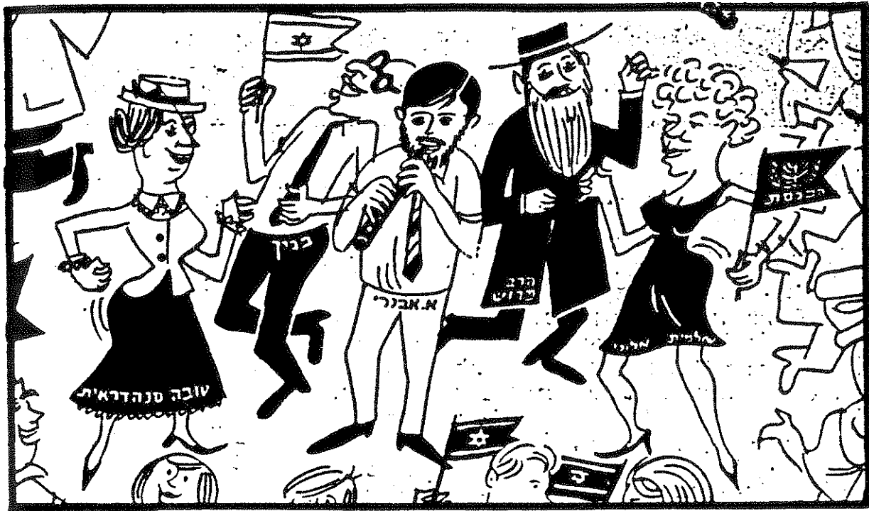
אורי אבנרי בכנסת. הקריקטורה במקורה, שצוירה ב-1965 על ידי לור, הופיעה בירחון הסתדרות הפקידים "שורות", ו"העולם הזה" העתיקה מיד